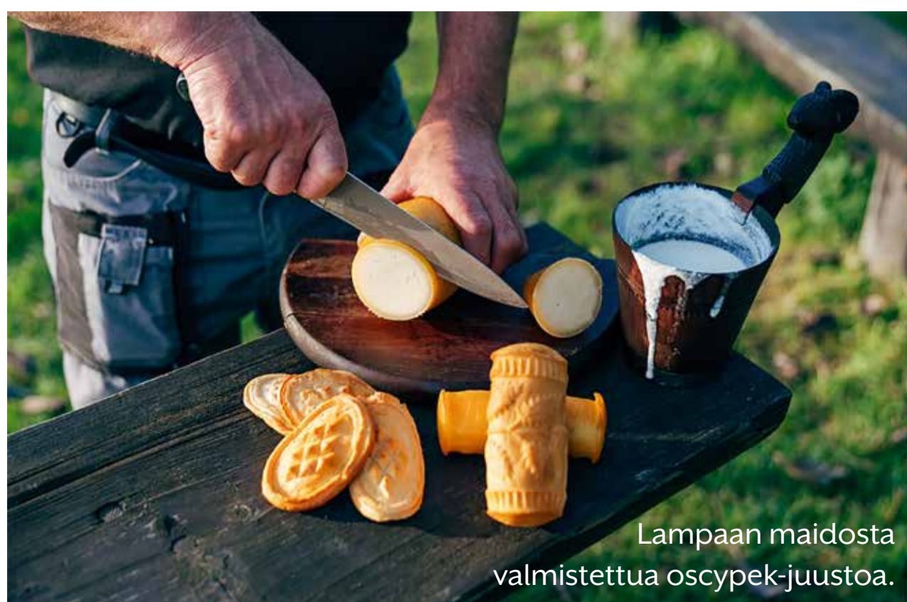
Lampaan maidosta valmistettua oscypek-juustoa.

Lue lisää Puolan viinireiteistä: https://visitmalopolska.pl/en/-/malopolski-szlak-winny-1356